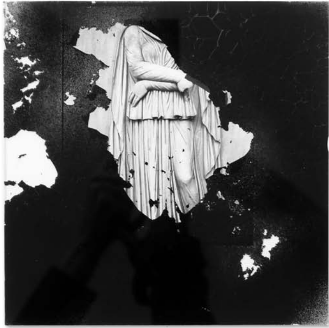
Figure 4 - Alteration, Tirage, verre, peinture, 30,5 x 30,5 cm, 2018