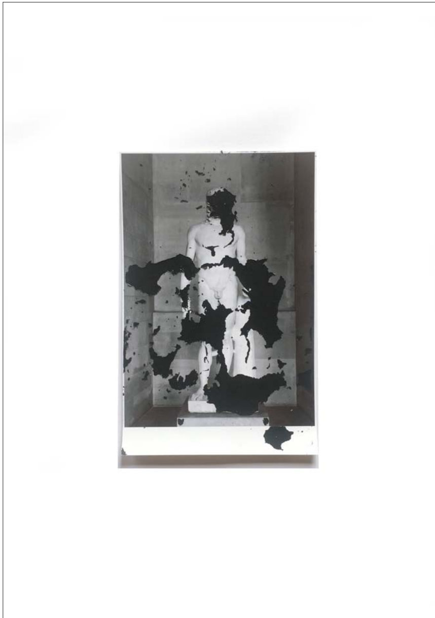
Figure 9 - Alteration, Tirage, peinture, 18,5 x 12 cm, 2018