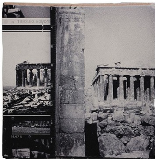
Fragments, Impressions sur faiences brisées