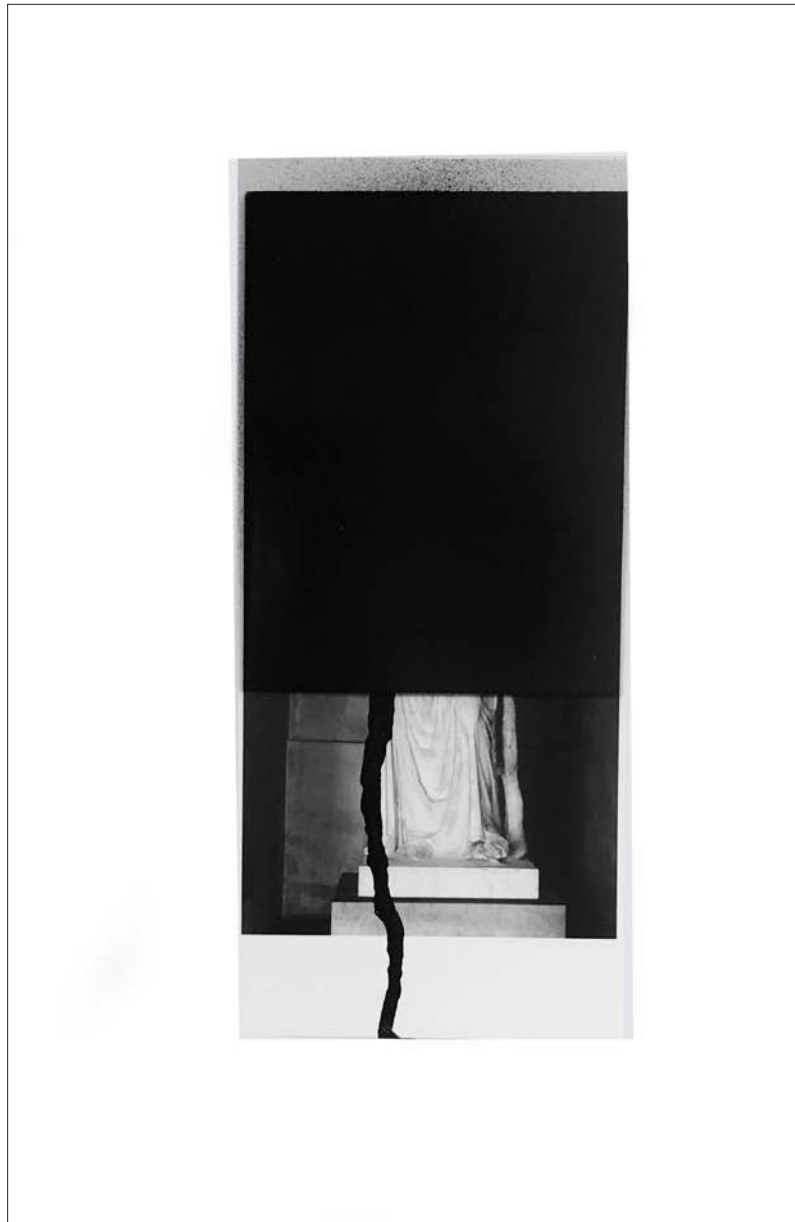
Figure 1 , Tirage, verre, peinture, 21 x 9 cm, 2018