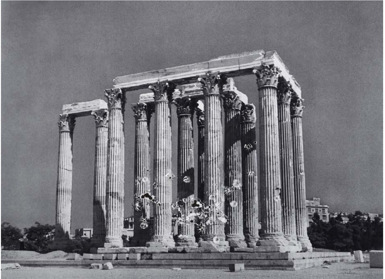
Temple de Zeus , Tirage contrecollé sur aluminium perforé par balles, 92 x 113 cm ou 120 x 150 cm