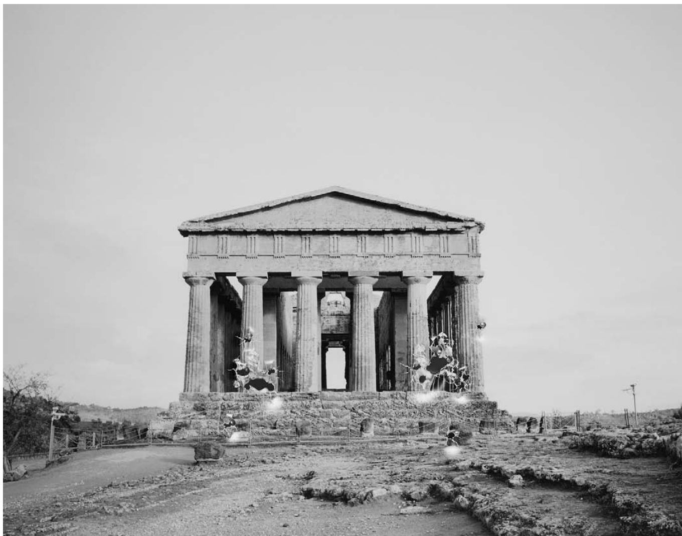
Temple de la Concorde , Tirage contrecollé sur aluminium perforé par balles, 92 x 113 cm ou 120 x 150 cm