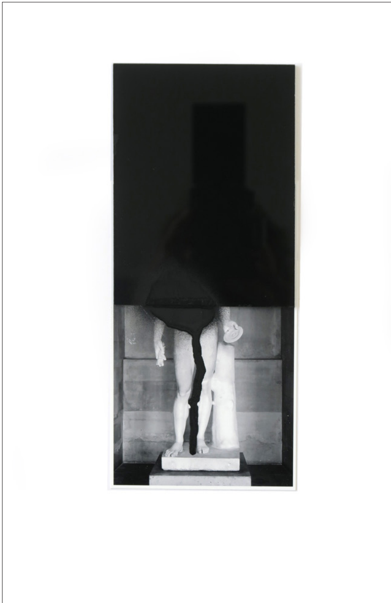
Figure 2 , Tirage, verre, peinture, 21 x 9 cm, 2018