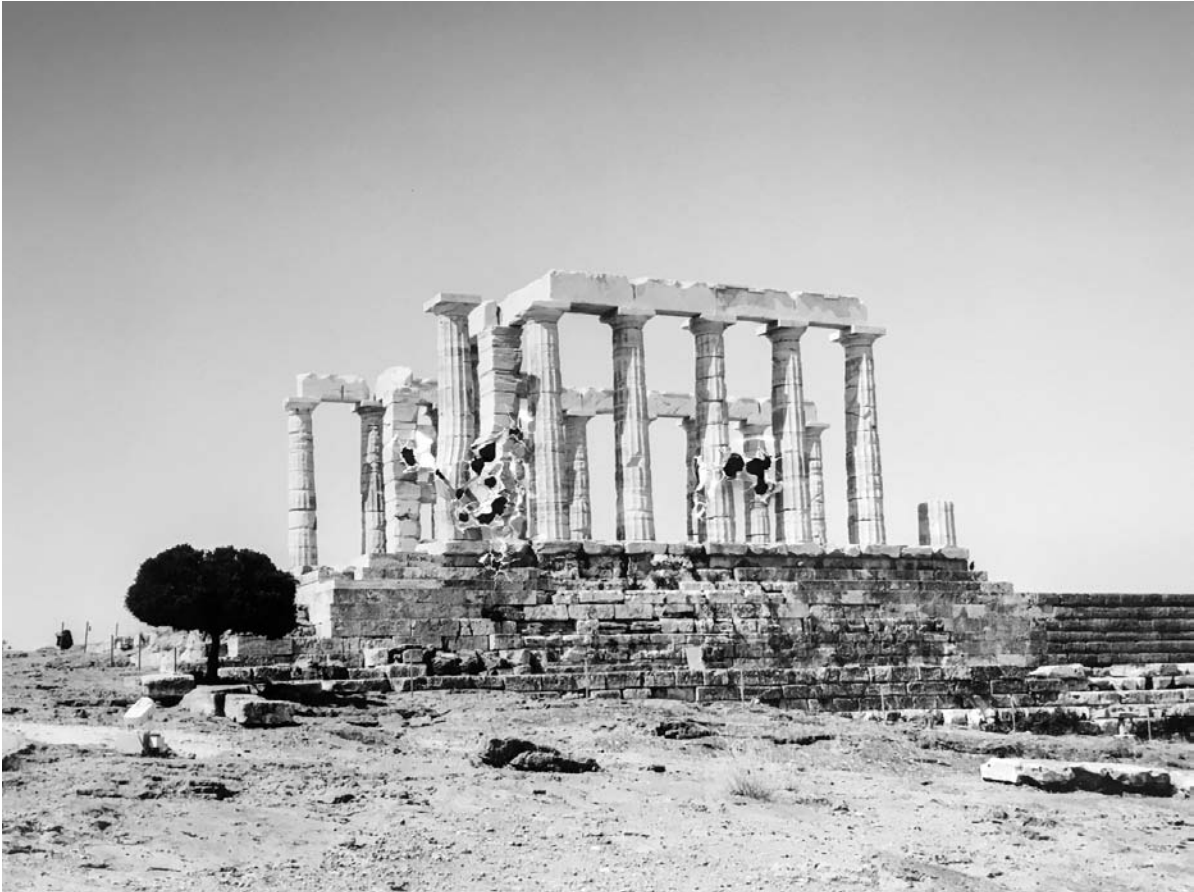
Temple de Poséidon , Tirage contrecollé sur aluminium perforé par balles, 92 x 113 cm ou 120 x 150 cm