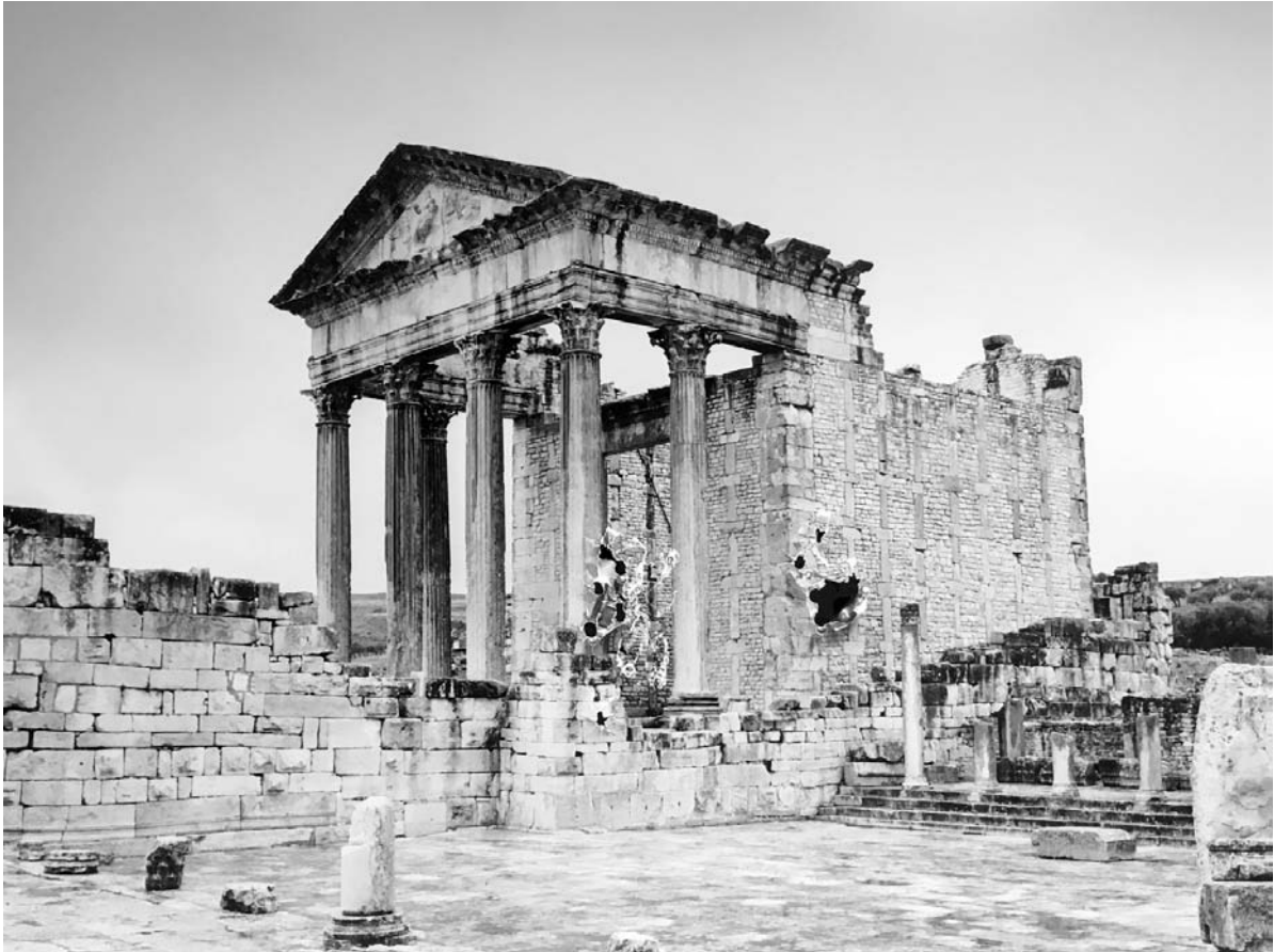
Temple Le Capitole, Thugga, Tirage contrecollé sur aluminium perforé par balles, 92 x 113 cm ou 120 x 150 cm