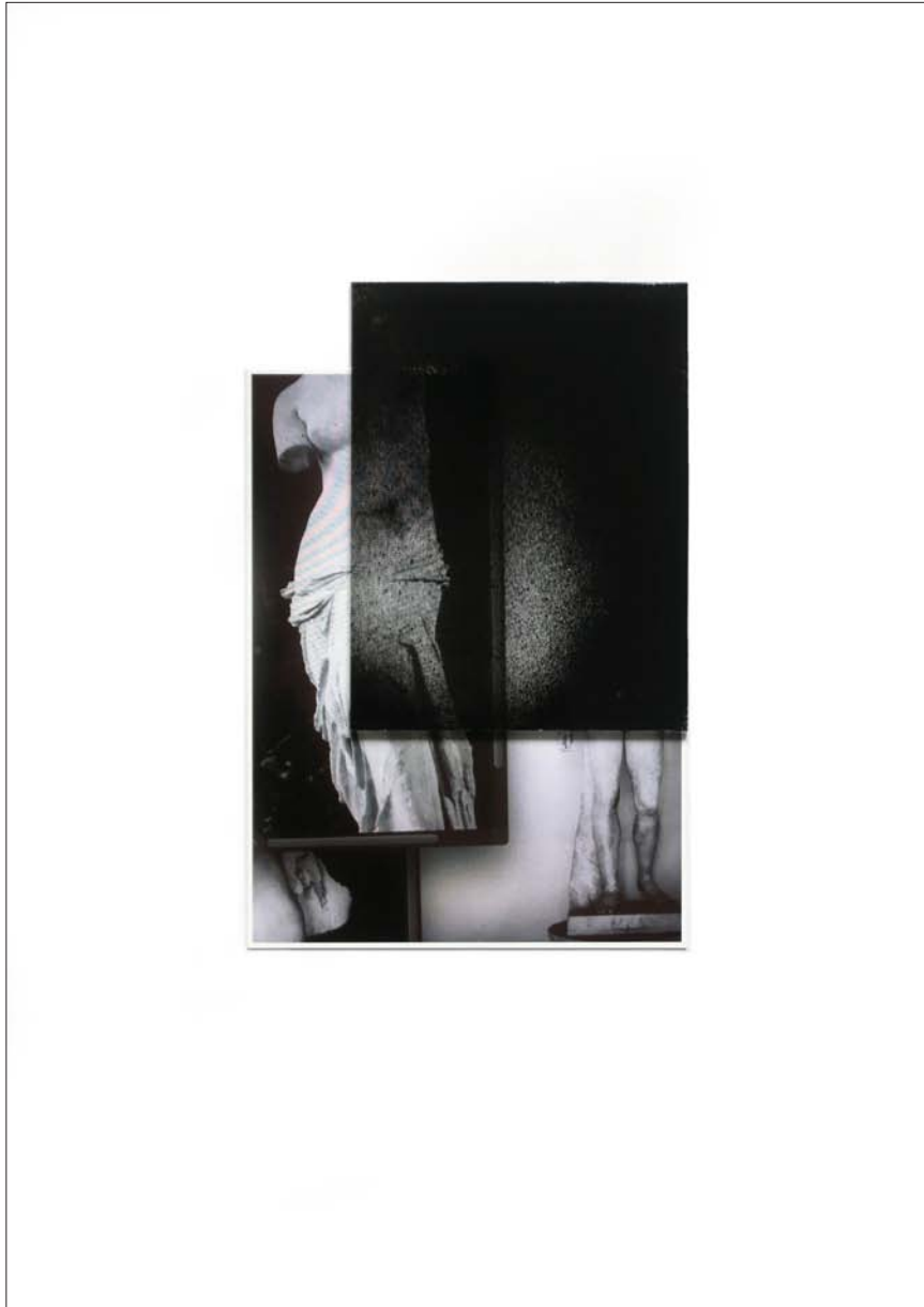
Figure 7 , Tirage, verre, peinture, 17,5 x 11,5 cm, 2018