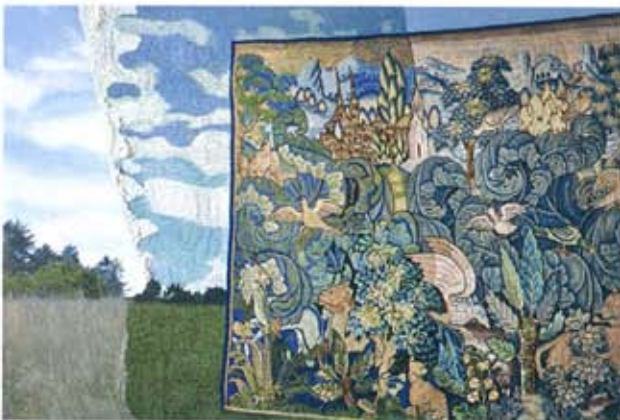
Aurélie Mathigot, Il m'a fallu tout abandonner, pour enfin m'échapper , 2013, photo imprimée sur toile, broderie fils, perles, crochet fils de lin, 130 x 97 cm.

Galerie Chevalier – Paris-7 e Jusqu'au 28 juin 2014