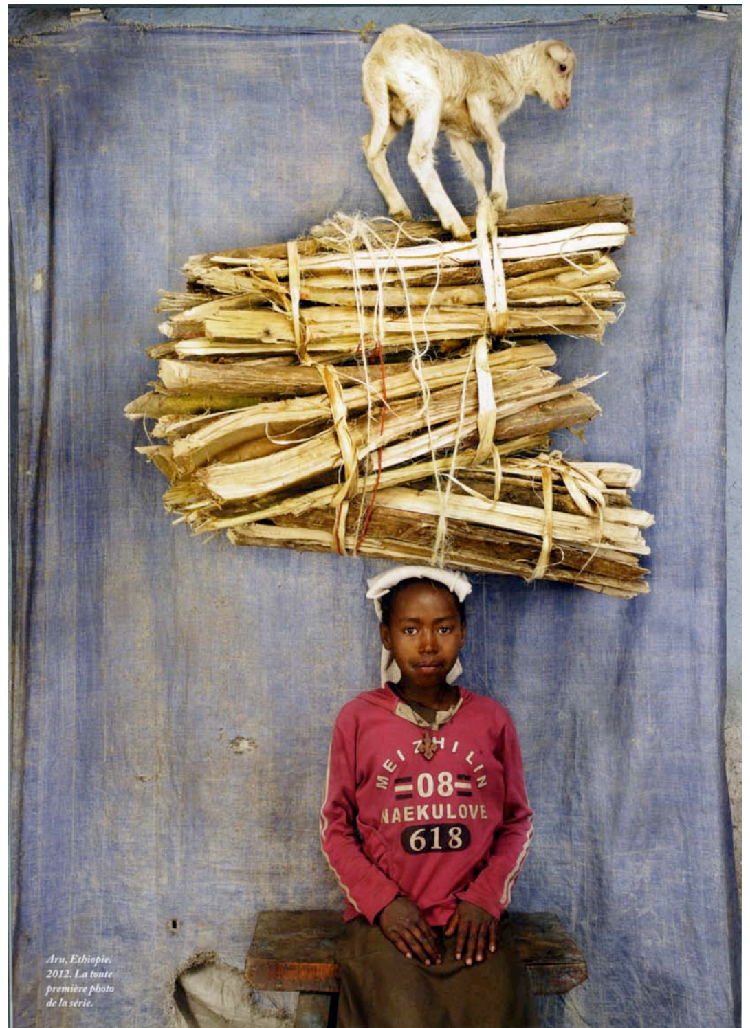
Aru, Ethiopie. 2012. La tonte première photo de la série.