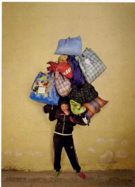
Sidney, centre de réinsertion, La Paz, Bolivie. 2013.