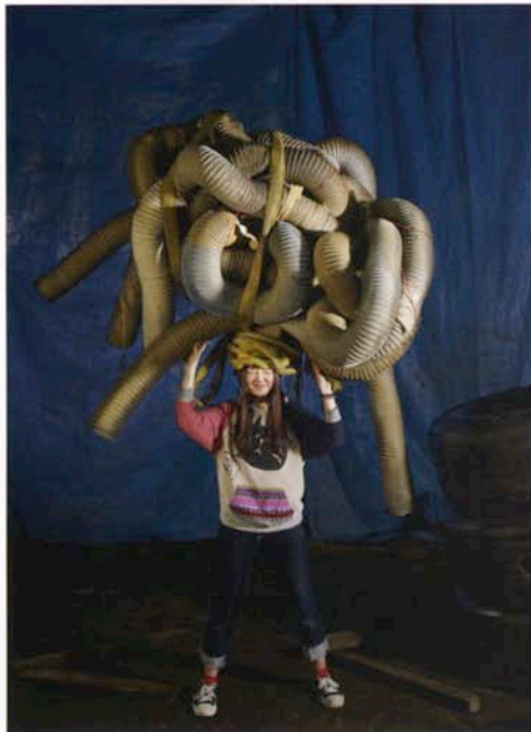
Misaki, Onomichi, Japon. 2013.