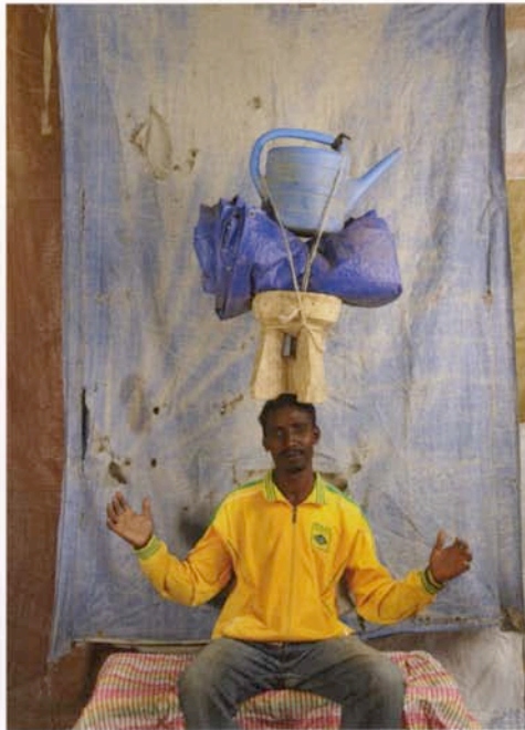
Desta, communauté rastafarienne de Sbasbamane, Ethiopie. 2012.