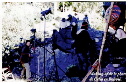
Making-of de la photo de Céline en Bolivie.