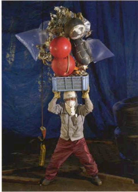
« Old man », Onomichi, Japon. 2013.