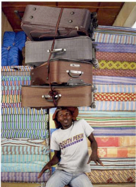
Casim, Rwanda. 2012.