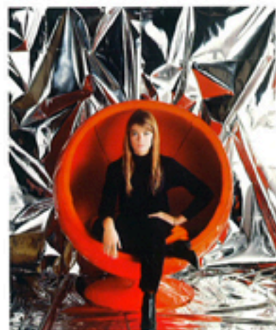
Jean-Marie Périer, Françoise Hardy, Novembre 1966, C-Print, 80 x 120 cm.

Il est rare de voir un photographe « d'idoles de la jeunesse » se prendre de passion pour l'un de ses modèles. C'est pourtant le cas de Jean-Marie Périer envers Françoise Hardy. Photographe de 1962 à 1974 du célèbre magazine Salut les copains , il réalise alors des dizaines, des centaines de portraits de tous les artistes yéyé. Pourtant le travail qu'il effectue avec Françoise Hardy, qu'il rencontre avant qu'elle ne soit encore connue, atteste d'une douceur rare dans ce