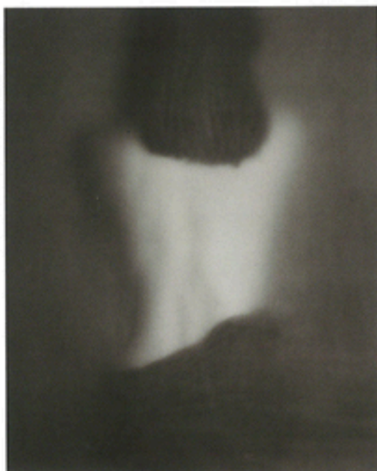
Byung-Hun Min, Sans titre , série Portrait , 2010, tirage gélatino-argentique, 124,3 x 109 cm (©BYUNG-HUN MIN, COURTESY LA GALERIE PARTICULIÈRE).

PARIS, « FRANÇOISE HARDY PAR JEAN-MARIE PÉRIER », galerie Photo 12, 14, rue des Jardins Saint-Paul 01 56 80 14 40 www.galerie-photo12.com du 27 octobre au 3 décembre.