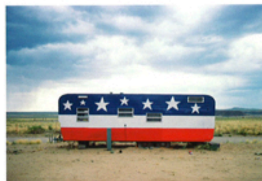
John Baeder, Trailer, Arizona Route 66 , 1975, C-Print, 50,8 x 76,2 cm.

PARIS, « BYUNG-HUN MIN, RÉTROSPECTIVE », La Galerie particulière, 16, rue du Perche 01 48 74 28 40 www.lagaleriesparticuliere.com Premier volet du 13 octobre au 20 novembre ; second volet du 24 novembre au 31 décembre.